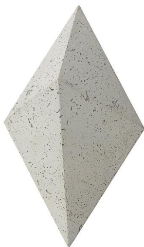
Płytki betonowa 3D, wzór Diament, Klinika Betonu

DIAMENT, betonowe płytki ściennie 3D, producent KLINIKA BETONU